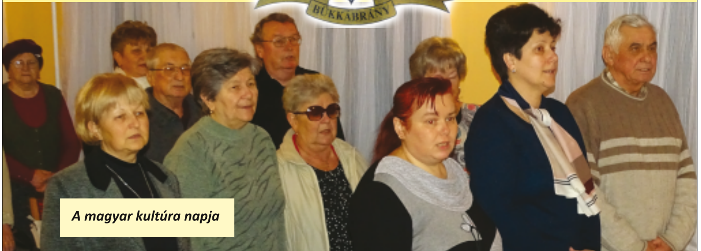
A magyar kultúra napja